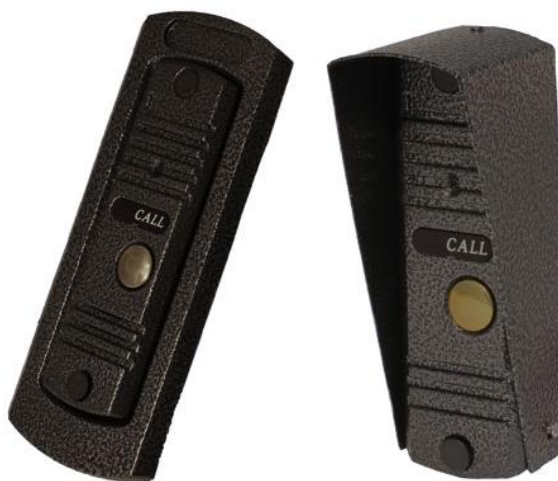
Вызывная панель для видеодомофонов HIQ-CCD9